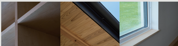
ikedakoumuten - open house_vol.225