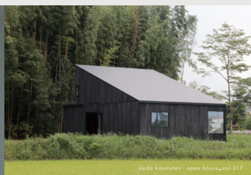
ikedakoumuten - open house_vol.217