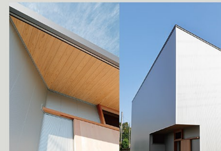
vol.107 step house