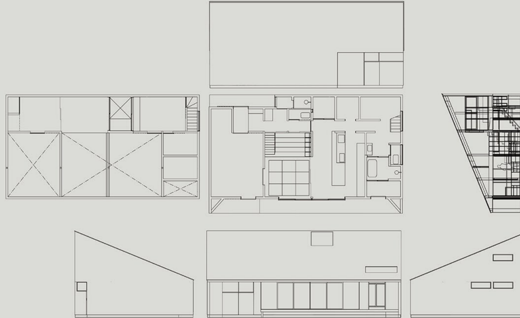
plan : neo-brain vol.107 step house

我々が大切にしているのは「対話」。 希望を叶える住宅を実現させるためには、まずお客様を知るところから。 建物は、できあがってからお客様との生活のスタートです。そこでどんな生活を送るのか、 家族がどんな成長をしていくのか。まずは何でもお話しください。そして一緒に考えましょう。