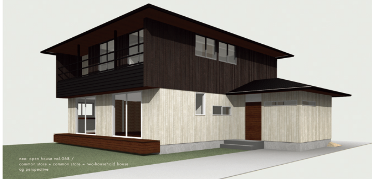
neo-open house vol.068 / common store + common store = two-household house cg perspective

common store + common store = two-household house Architect : takuya hasegawa / ADT